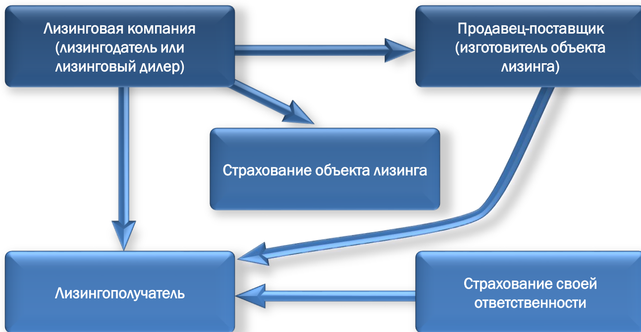
Схема лизинговых правоотношений с учетом страхования объекта лизинга и ответственности лизингополучателя, которое производится на практике в большинстве случаев, выглядит следующим образом: